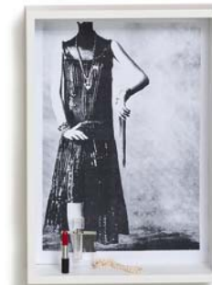
Kleine Beauty- Oase: Die Ablage von Spiegel „Pii“ ist wegklapp- bar, drei Ver- sionen, Preis auf Anfrage (Famos)