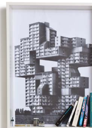
Bilderrahmen und Regal in einem: „ET“ wird komplett in Deutschland hergestellt, ab 128 Euro (Liot Llov)