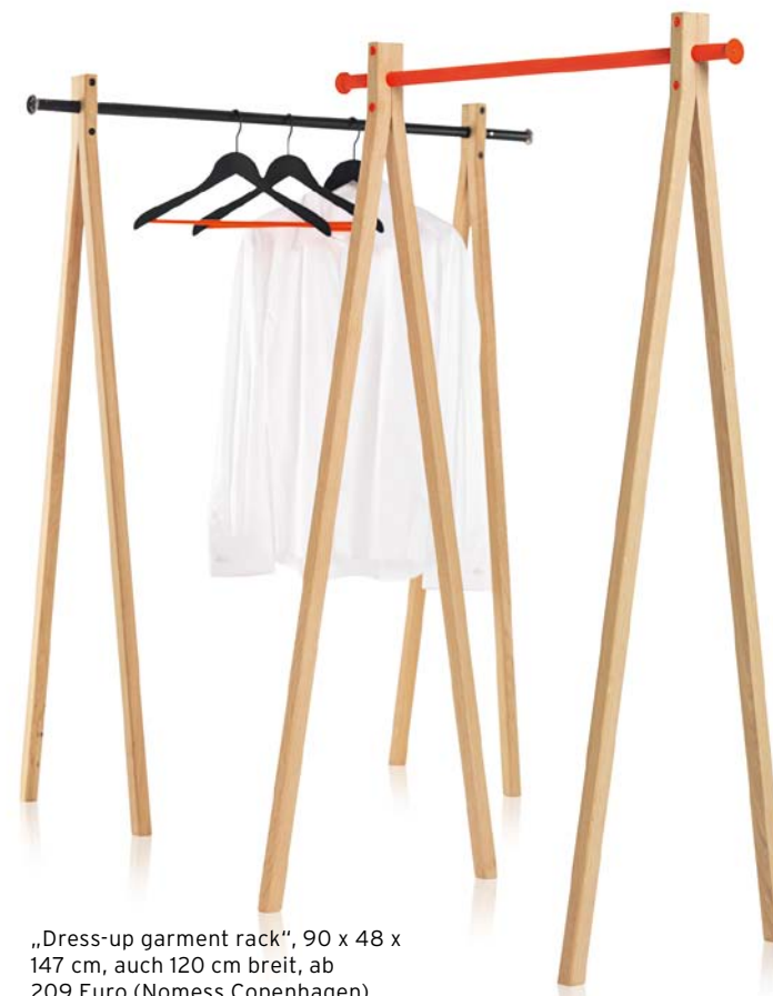
„Dress-up garment rack“, 90 x 48 x 147 cm, auch 120 cm breit, ab 209 Euro (Nomess Copenhagen)

wird Licht vom Dach ins Hausinnere geleitet – je kürzer der Weg, desto heller der Raum ( www.lichtkamin.de )